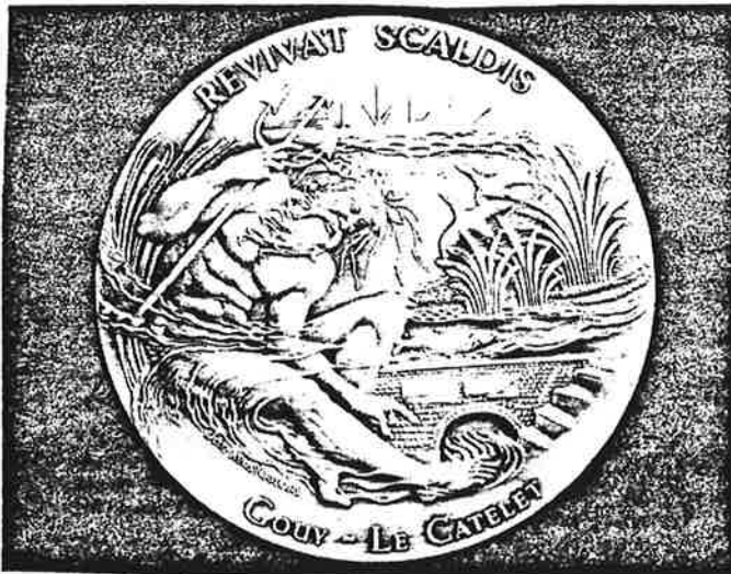
Afbeelding van gedenkpenning uitgegeven door ESPA ter gelegenheid van de aankoop van de Scheldebron.

van de delta van Maas, Rijn en Schelde zich in de Noordzee te werpen.